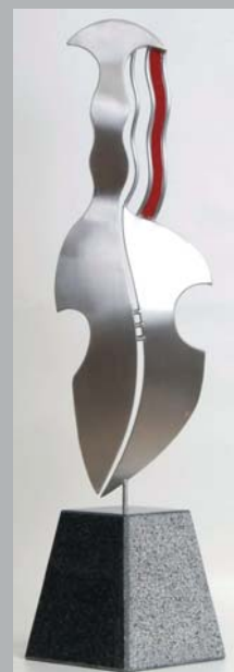
CELLO BYDER OP. Rustfrit stål, børstet på blå Rønne granit og hånd-slebet rødt glas