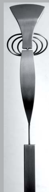
FISK I SPRING. 165 cm. høj, rustfrit stål, børstet, på blå Rønne granit.