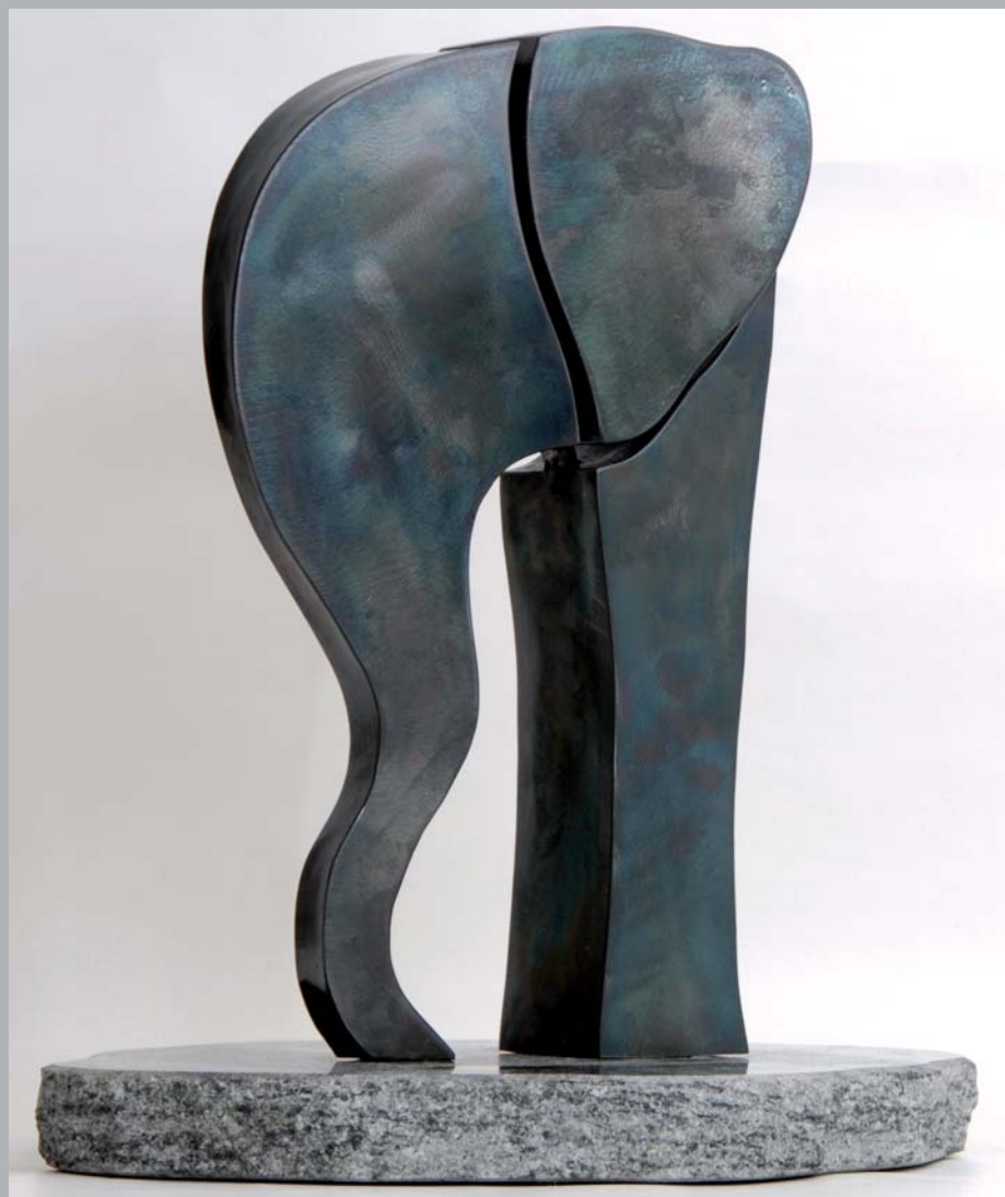
HVILENDE ELEFANT. Jern, slebet og oxyderet for blålige og rødlige kontraster, 43 cm. høj på grøn granit fra Sydamerika.

Jeg laver små og store skulpturer hos PMJ, hvor der både er kraner og truck. PMJs ingeniører laver styrkeberegninger, der sikrer, at de store skulpturer kan holde. PMJ kan håndtere alle opgaver og størrelser", siger hun og henviser interesserede til sin hjemmeside skulptur.nu eller til PMJs telefonnummer 3630 4477.