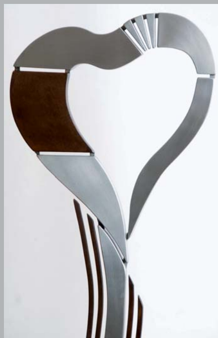
HJERTERUM. 140 cm. høj i børstet rustfrit stål og syrebehandlet jern på Moseløkke granit fra Bornholm.