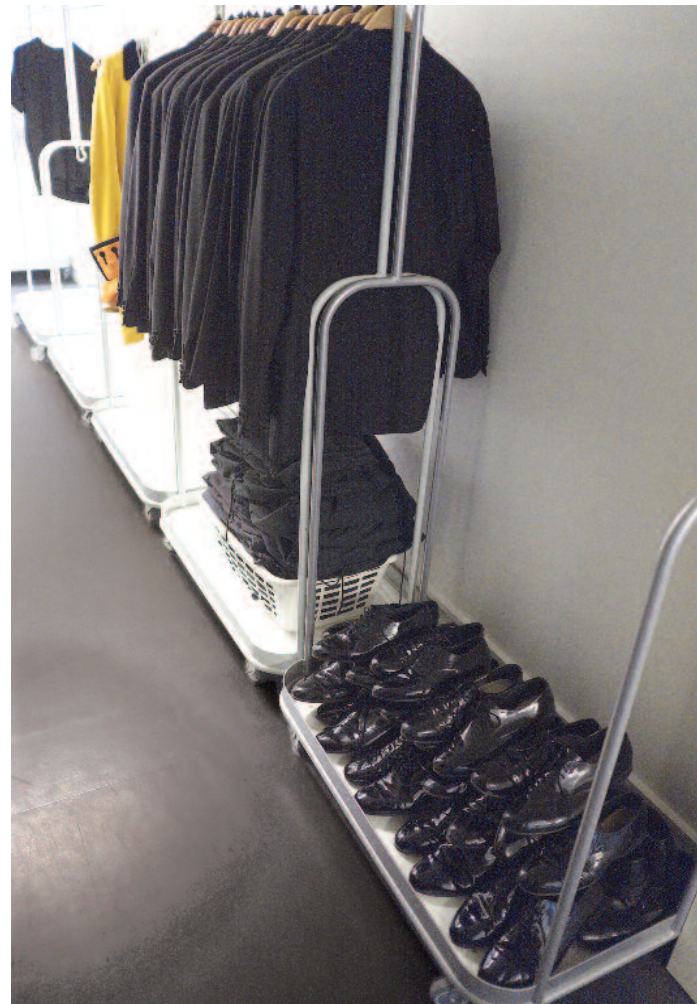
EFTER FOLKEFESTEN. Her er operakorets laksko, smokingjakker og -bukser samlet efter Det kongelige Teaters gratis optræden ved folkefesten på Skamlingsbanken søndag 23. august og Rosenborg Eksercerplads lørdag 22. august.

Så længe en forestilling er på plakaten, bliver kostumer såvel som kulisser opbevaret i den store grå hal på Refshaleøen, B&Ws gamle skibsbjgningshal, hvor Eurovision Song Contest 2014 blev holdt. Når et stykke er spillet færdigt, bliver kostumerne splittet op i sine bestanddele, jakke og bukser, og ryger på lageret.